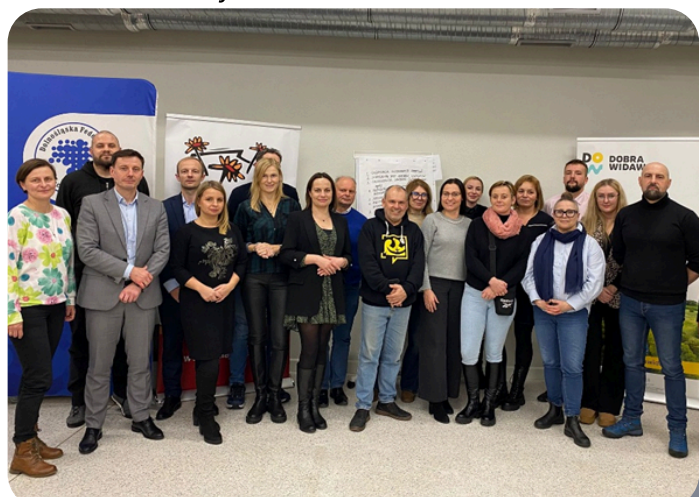
Warsztaty we Wrocławiu 26.11.2025 r.